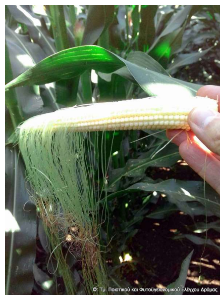
Εικόνα 2. Απόπτωση στύλων (η εικόνα δείχνει το στάδιο τού ~70% γονιμοποίησης).