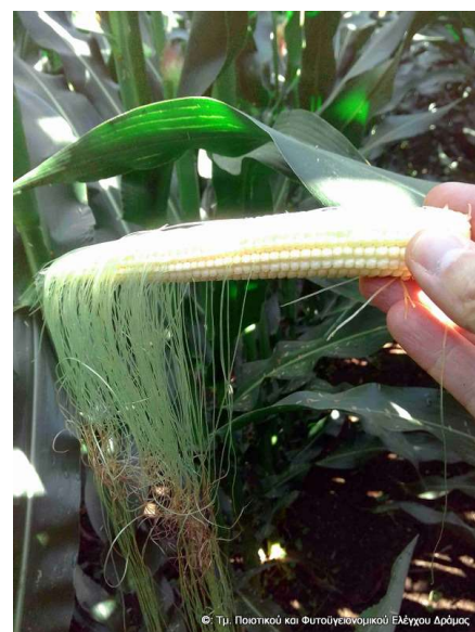
Εικόνα 2. Απόπτωση στύλων (η εικόνα δείχνει το στάδιο τού ~70% γονιμοποίησης).