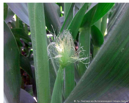
Εικόνα 1. Εμφάνιση στύλων.

https://planthealthdrama.wordpress.com/2020/02/19/διαβρώτικα-οδηγίες-αντιμετώπισης-2020/